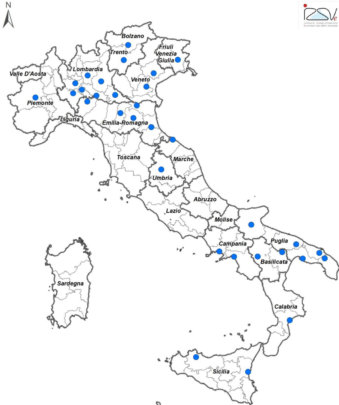
Figura 1: laboratori partecipanti schema AQUA MD1 - 2024

Hanno partecipato allo schema AQUA MD1-2024 Ricerca di Taylorella equigenitalis , trentadue laboratori.